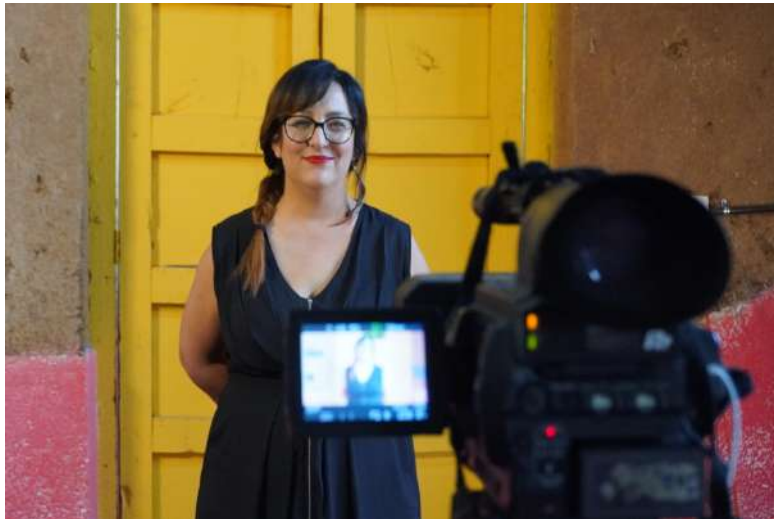
Dir. Sunya Madrigal

©2020 ORIGEN 19º 41' 53" N • GRUPO RATIO • LA SERPIENTE DANZA CONTEMPORÁNEA. Todos los derechos reservados.